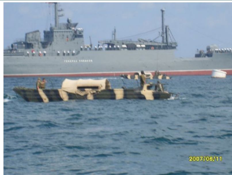
Парад, посвященный Дню ВМФ