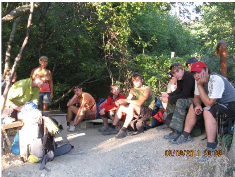
Участники в походе